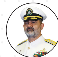
امیر دریادار شهرام ایرانی فرمانده نیروی دریایی ارتش جمهوری اسلامی ایران